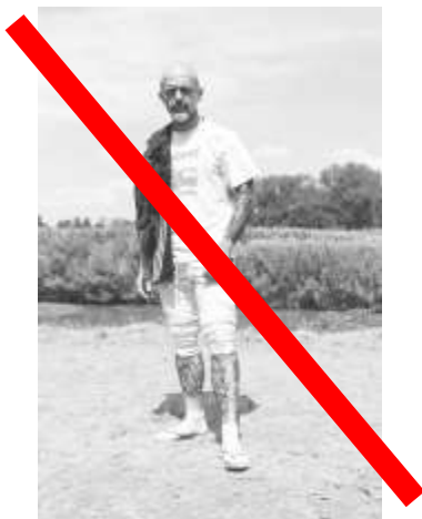
Sopra è indicato un esempio VIETATO

Obbligo di presentarsi come da figura sotto, visto che l'evento sarà trasmesso a livello Internazionale da IFMA