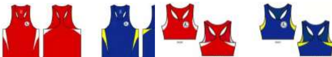
Femminile (fig. 2)

Pantaloncini come da disegno, per tutti, oppure colore NERO per entrambi gli atleti (fig. 3)